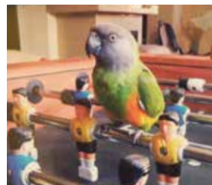
Szymon Frankowski, ZSS nr 2 w Chorzowie