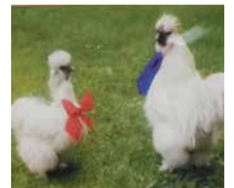
Emilia Wołoszyn, ZSP nr 2 w Mysłowicach

Treści zawarte w publikacji nie stanowią oficjalnego stanowiska organów Wojewódzkiego Funduszu Ochrony Środowiska i Gospodarki Wodnej w Katowicach