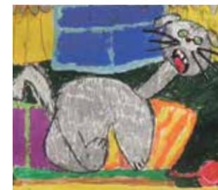
Anastazja Szustak, Przedszkole Integracyjne nr 12 w Chorzowie