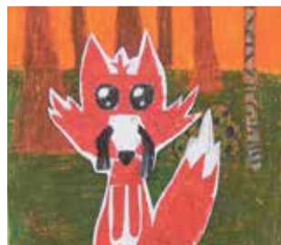
Oliwia Zaworska, SP nr 41 w Gliwicach